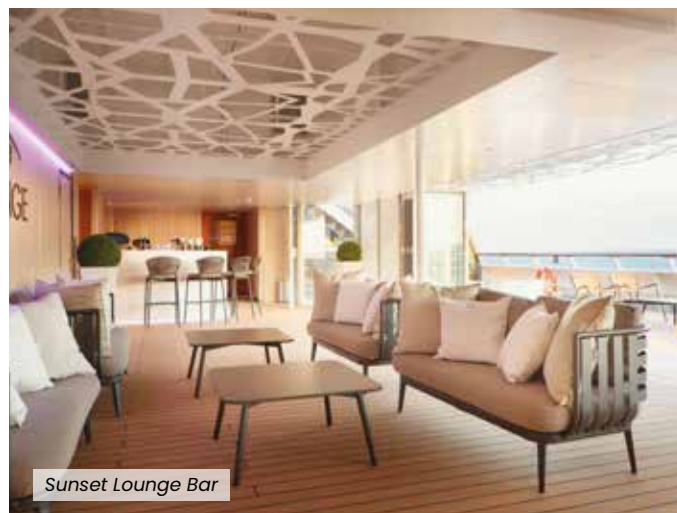
Sunset Lounge Bar